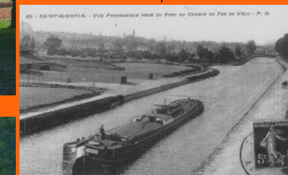
Vue panoramique au pont du chemin de fer de Vêlu