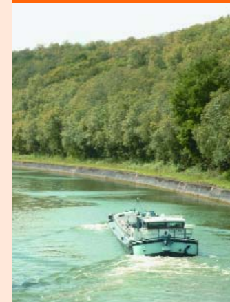
Péniche naviguant sur le canal