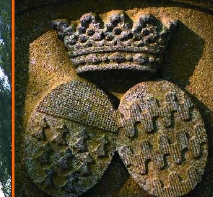
Armoiries Cardevacque d'Havrincourt