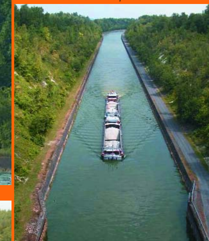
Le Pont d'Hermies vous offre un magnifique point de vue